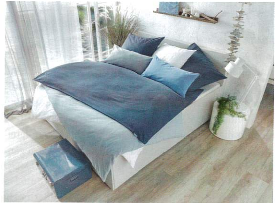
Bettwäsche von Ocean Safe: Alles, was das Unternehmen produziert, ist biologisch abbaubar.

„Bedenkt man von Anfang an den vollständigen Produktkreislauf mit dem Anspruch, keinen weiteren Abfall im herkömmlichen Sinne entstehen zu lassen, müssen Produkte wieder in den biologischen Kreislauf geführt werden können. Das ist Ocean Safe nach der Idee des Cradle to Cradle-Prinzips“, erklärt Schweizer. „Unsere Produkte können dem biologischen Kreislauf sicher zugeführt werden, denn sie sind frei von jeglichen Schadstoffen und 100 Prozent biologisch abbaubar. So sind alle ausgewaschenen Mikrofasern unserer Textilien für den biologischen Kreislauf absolut unbedenklich. Und nach Gebrauch hinterlassen unsere Produkte keinerlei Abfall, sondern werden zu Nährstoff für kommende Generationen.“